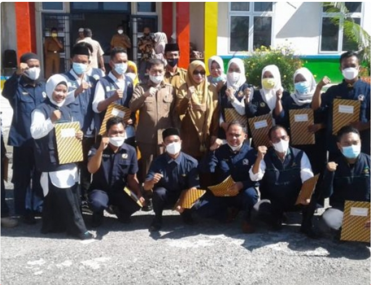
Gambar : Sekda Aceh Tenggara Poto Bersama 16 Anggota TKSK

Aceh Tenggara - Sekretariat Daerah (Sekda) Kabupaten Aceh Tenggara mengukuhkan dan sekaligus membagikan Surat Keputusan (SK) kepada 16 orang Tenaga Kesejahteraan Sosial Kecamatan (TKSK) se-Kabupaten Aceh Tenggara, di Depan Kantor Dinsos Aceh Tenggara. Selasa (12/04/2022).